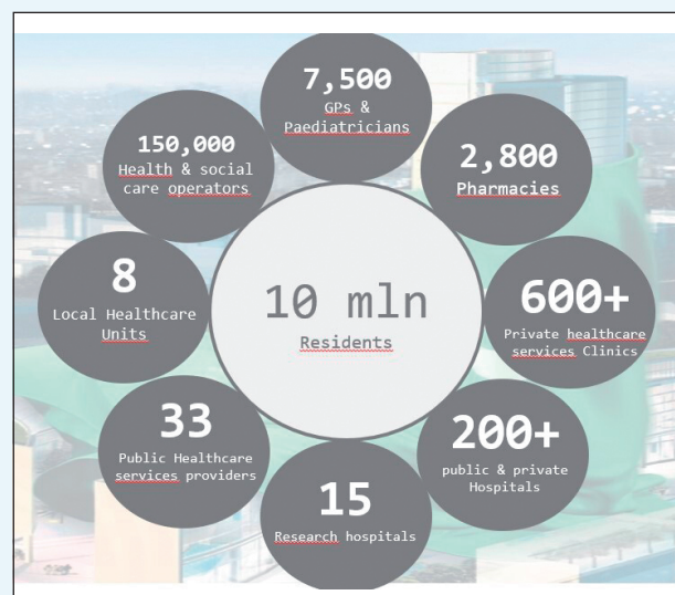
La struttura del sistema sanitario lombardo

L'AI non è una sfera magica, può produrre errori interpretativi che potrebbero portare a danni significativi, soprattutto in ambito sanitario. È quindi fondamentale mantenere competenze tecniche e tecnologiche, investendo anche in corsi di formazione e puntando a disporre delle figure professionali più idonee.